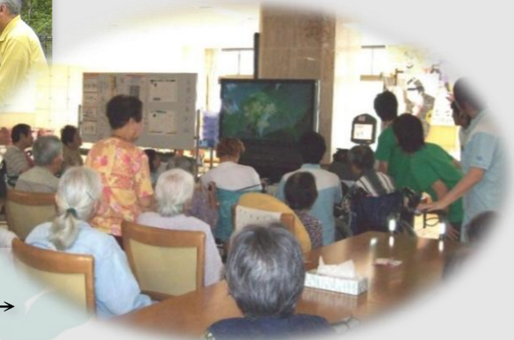
放送を見る利用者様→

こうして一年ごとに花をつける木の数は増えていき、毎年花のついている木を探すのが楽しみとなりました。